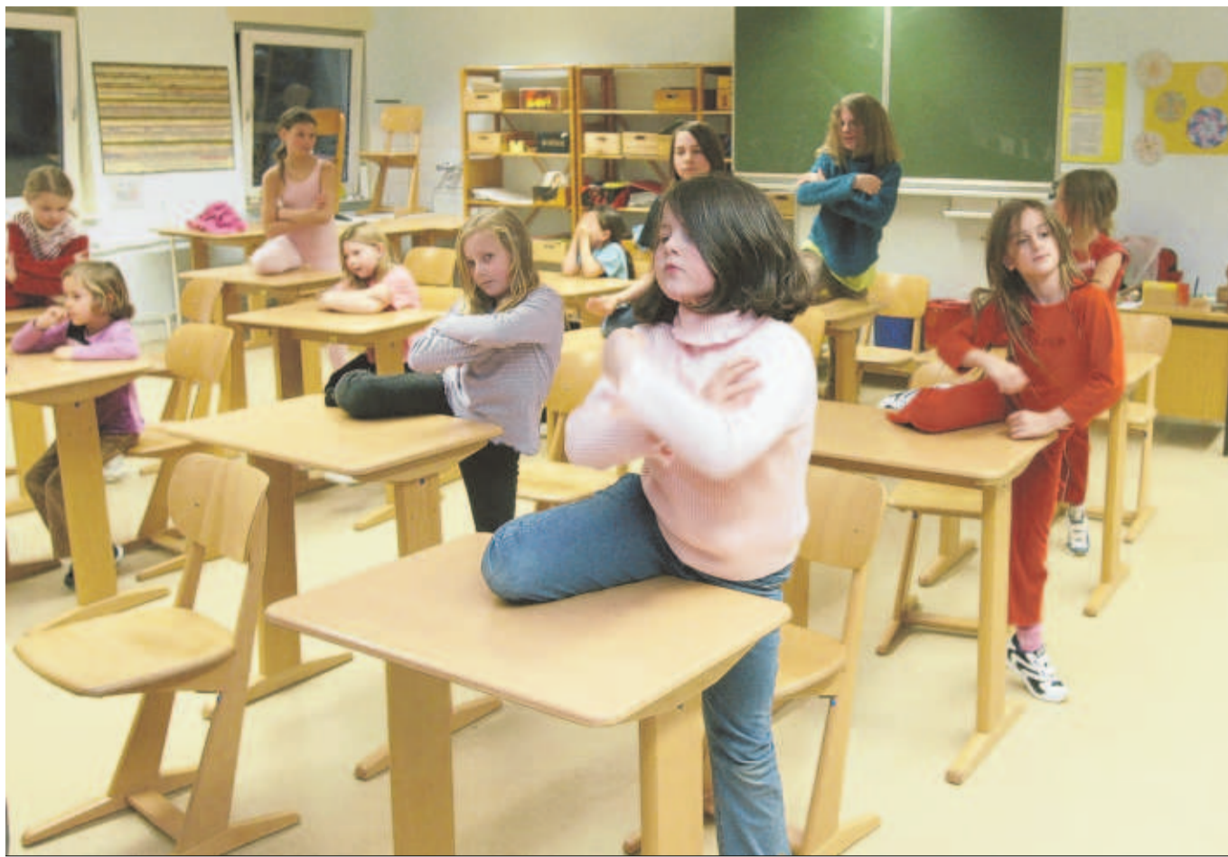
Klasse(n)raum heißt das Tanztheaterprojekt, mit dem die Hofheimer Montessori-Schüler an einem bundesweiten Wettbewerb teilnehmen.